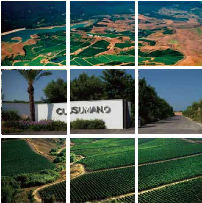
#クズマーノ #アンジンベ #イタリア #シチリア