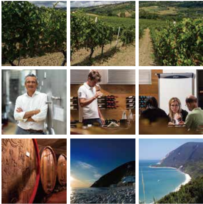
#ウマニロンキ #カサルディセツラ #イタリア #マルケ