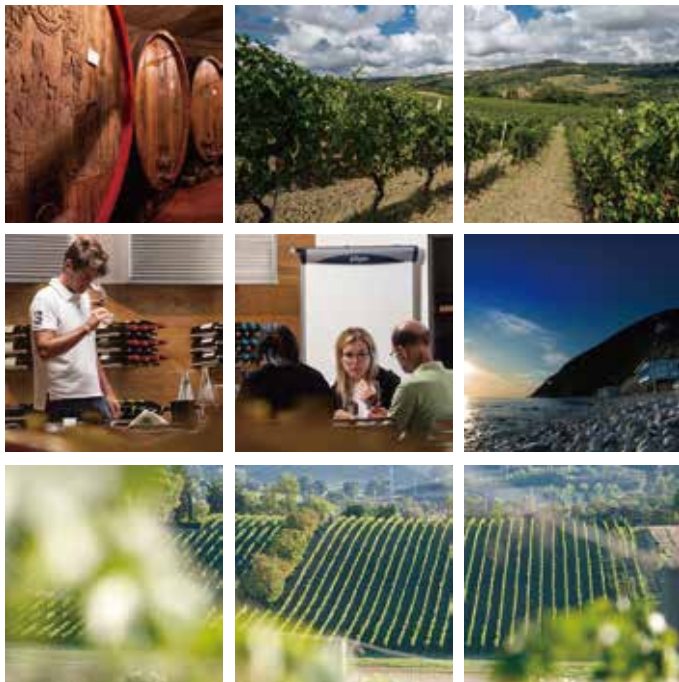
#ウマニロンキ #サンロレンツォロッソコーネロ #イタリア #マルケ